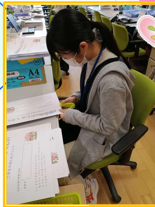
高千穂小学校の取り組み