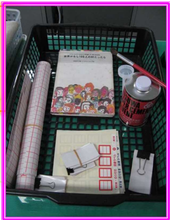
上野中学校の取り組み (図書修理)