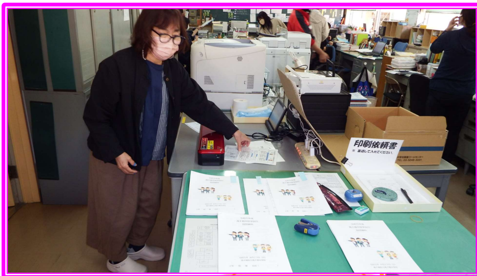
高千穂中学校の取り組み