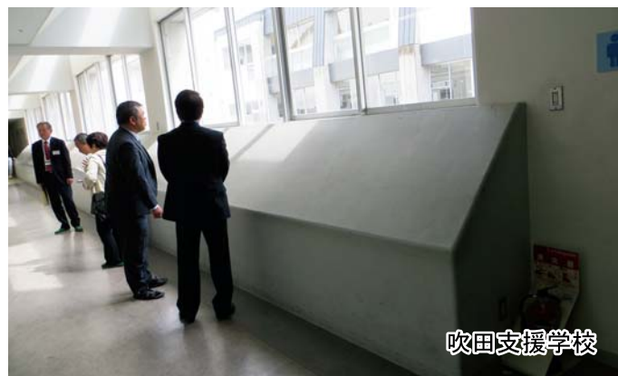
吹田支援学校 窓からの転落防止のために作った壁。安全管理を徹底していました。