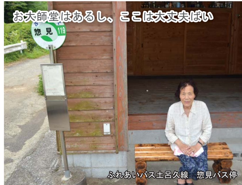
ふれあいバス土呂久線 惣見バス停

バスは、自動車免許を持たない高齢者や学生にとって「足」であり「移動手段」である。また、景観も損ねており、良い印象を与えない。設置箇所の掌握と、