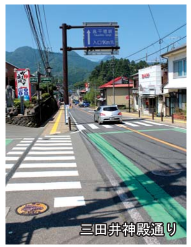
まちなか景観区域とは…高千穂峡・高千穂神社・神代川周辺を含めた三田井地区と、天岩戸神社・天安河原を含めた天岩戸地区のことをさします。