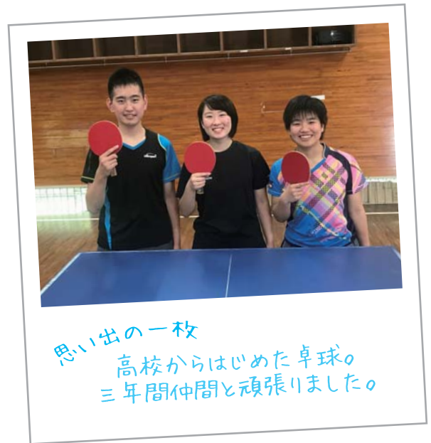
思い出の一枚 高校からはじめた卓球の三年間仲間と頑張りました。

「高千穂の好きなところは？」 自然が豊かなので、シカやイノシシも含めて、動物が暮らしやすいところが好きです。