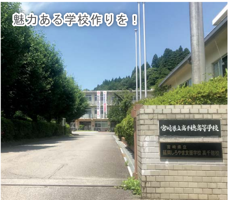
魅力ある学校作りを!

【一般質問とは?】 一般質問は議員の日常活動や考え方にに基づき、町長もしくは教育長に対する質問の要旨をまとめ、指定日までに議長に通告します。 1人の制限時間は60分一問一答方式で町長などの基本方針をたずぬるものです。 町政全般について自由な質問が許された議員の権利で、町民の身近な課題や町政発展に関わる質問を活発に議論しています。 議会だよりは、紙面が限られており、原稿は1人600字以内に制限していますのでぜひ、町民のみなさんの傍聴をお待ちしています。