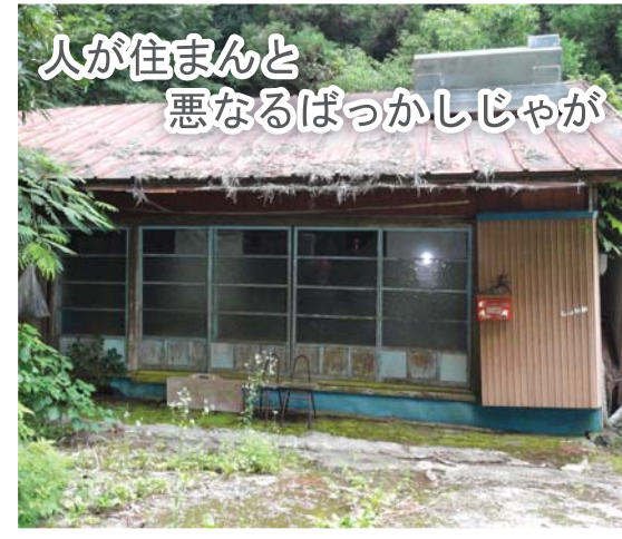
人が住まんと悪なるばっかしじゃが

町長 ①224戸の空き家所有者に対し、アンケートによる意識調査を行っており、今後も継続していく。 町長 空家情報の公開をNPO法人に委託