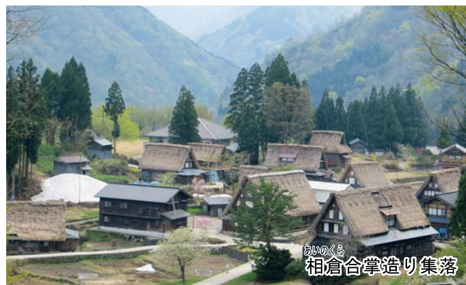
相倉合掌造り集落