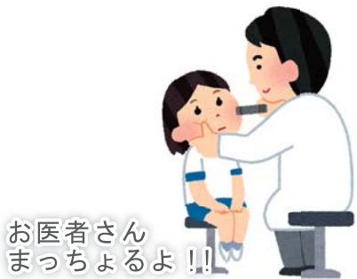
お医者さんまっちゃん!!

商工会も移転しても多額の改修費がかかるため移転は保留の状況である。 場所的に立地条件が良いので町民が気楽に來られる施設にしたい。