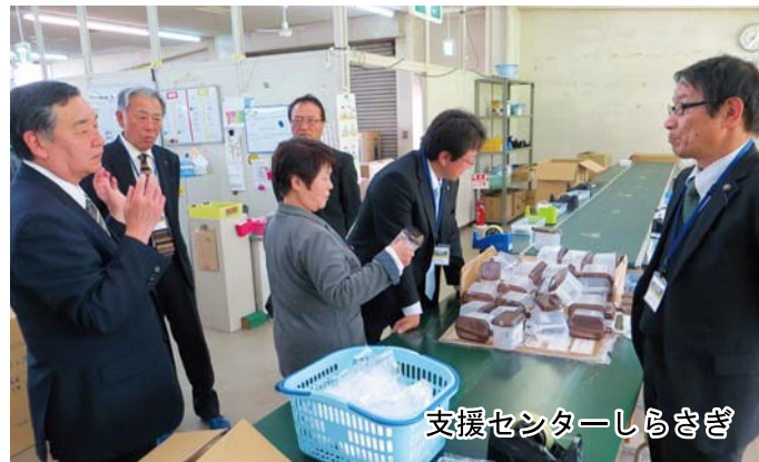
支援センターしらさぎ 日用品組立作業、洗車作業、縫製作業などグループでおこなっていました。

支援センターしらさぎでは、6年間を2年単位、3段階での就労支援事業をおこない、就職実績を上げています。（現在利用者数51名） また吹田支援学校では小・中・高一貫の教育で、「感覚に敏感な生徒にやさしい」環境での教育を実践しています。（生徒数233名） 京都府立図書館については、最新の図書管理が行われています。（年間貸出者数 約92,000名） これらの先進施策を学ぶために訪問しました。