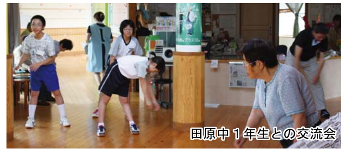
田原中1年生との交流会

委員会の意見 指定管理者の指定にあたり、職員の異動、ときわ園の定員不足による運営状況、社会福祉協議会の事業実績など問題点もある。近年の介護保険法改正により、介護度1、2の人の受け入れ施設が減少しているため、事業内容を見直し、町民が安心して、利用できる施設となるよう要望した。 賛成多数で可決