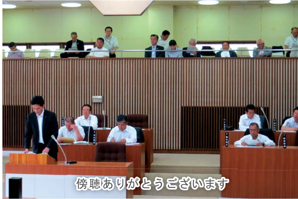
傍聴ありがとうございます

6月18日の第二回定例会本会議に、椎葉村議会議員10名が来訪されました。 村議会において一問一答方式の一般質問を導入したいとの考えから、本町の一般質問を傍聴され、感想として質問内容や時間配分など、大変参考になったとの話でした。