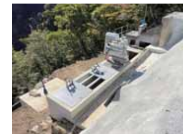
ゲートマン(取水口)