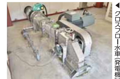
クロスフロー水車(発電機)