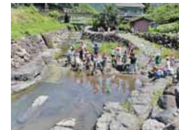
◀ 神代川かわまちづくり

高千穂町は宮崎県内有数の観光地でもあります。住民の生活利便性向上はもとより、訪れる観光客の皆さんの満足度の向上を図るため、まちなかの歩行空間や魅力的な観光スポットの創出を官民協働で取り組んでいます。観光客がまた来たい、また地域の人が訪れる高千穂のまちづくりを目指しています。