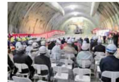
◀ 五ヶ瀬高千穂道路 トンネル貫通式