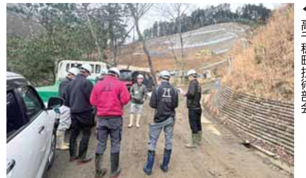
◀ 高千穂町技術部会

なつかしい未来へ向けて線路は伸び続ける。105mの鉄橋から広がる壮大な景色を、グランドスーパーカートで楽しめる30分間の旅です。