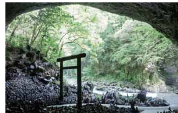
◀ 天安河原(あまのやすかわら)

天照大神(アマテラスオオミカミ)が岩戸にお隠れになった際、天地暗黒となり八百万(やおよろず)の神がこの河原に集まり神議されたと伝えられる大洞窟。日本屈指のスピリチュアルスポットとしても有名です。