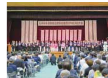
◀ 九州中央自動車道 西臼杵総決起大会

現在、高千穂町内では国土交通省により九州中央自動車道「五ヶ瀬高千穂道路」「高千穂雲海橋道路」が事業化となり、着工したトンネルが貫通式を迎えました。高千穂町も早期の全線着工完成のため提言活動や沿線住民の方々との連絡調整を行っています。