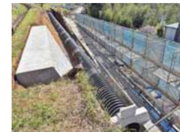
用水路の暗渠化工事