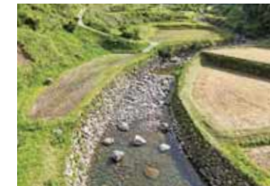
◀ 河川災害復旧工事