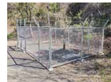
水源ボーリング工事