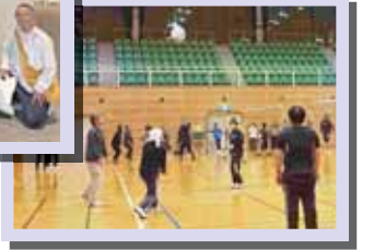
▲ 各課対抗レクリエーション