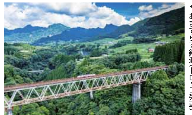
◀ あまてらす鉄道(トロッコ列車)

高さ約80～100mもの断崖が約7kmに渡って続く高千穂峽。国の名勝・天然記念物にも指定されており、年間を通して県内外もとより、世界中から観光客が訪れます。