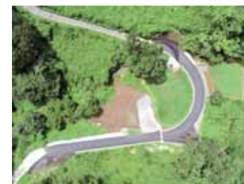
集落道の改良工事

生活環境基盤となる、営農飲雑用水施設（水道施設）、集落道の改良工事、排水路工事等を県の補助事業を活用しながら整備を行っています。宮崎県と連携しながら総合的に事業を行うことで、地域の活性化や定住の促進、国土・環境の保全に繋がっています。