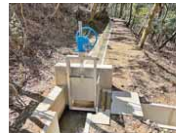
用水路の改修工事

農業生産基盤である、用水路等の農業用施設の改修や更新・農道整備工事等を、国の補助事業を活用しながら計画的に整備を行っています。これらの事業の積み重ねにより、生産性の高い農業を促進し、地域農業の持続的発展や農村の総合的な振興が図られます。