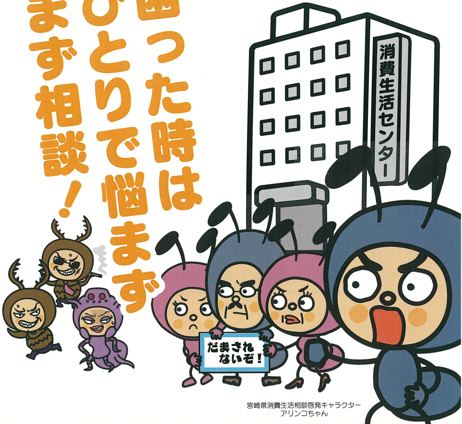
宮崎県消費生活相談啓発キャラクター アリンコちゃん