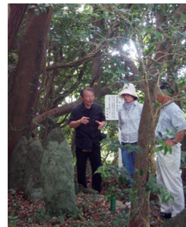
文化財(天然記念物)候補の調査