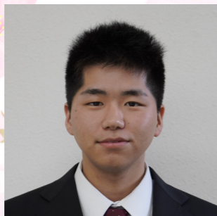
上下水道課 土木技師