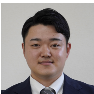
企画観光課 一般事務

町職員として、町民の皆様のお力になれる様尽力していくと共に正確に業務をこなせるよう努めてまいります。