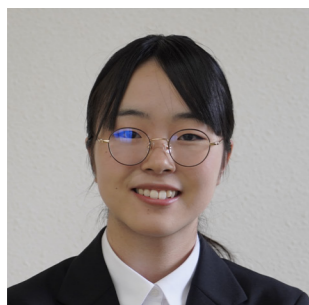
町民生活課 一般事務

謙虚に学びを続け、職務に生かし、信頼される職員として高千穂町に貢献してまいります。