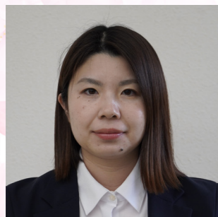
保健福祉総合センター 管理栄養士 (西臼杵広域行政事務組合高千穂町国保病院出向)