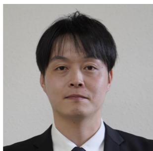
上下水道課 一般事務