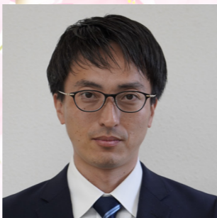
企画観光課 一般事務

土木の技師としてはまだまだ未熟ですので、技術を磨いて高千穂町民の生活を快適に出来るよう頑張ります。