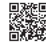
ポリテクセンター延岡