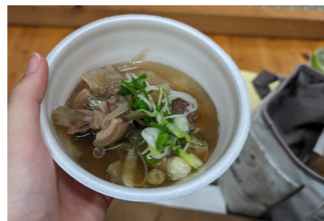
しし汁(野方野夜神楽)

3月下旬に引越し、慌ただしい毎日が続いていますが、仕事に聞こえるウグイスの鳴き声や通勤中に広がる絶景に、日々癒されています。休日は尾戸の口の展望台から棚田を眺めたり、天岩戸温泉に行ったりと高千穂生活を満喫中です。また、神楽が好きなので、今から夜神楽の時期を心待ちにしています。