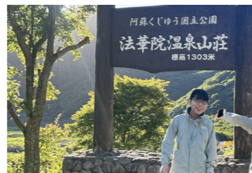
法華院温泉山荘にて

生まれは熊本、育ちは福岡です。大学卒業後に福祉の専門学校に通い、障害福祉サービス事業所B型で働いていました。2022年の夏に初めて高千穂を訪れてから、自然の豊かさや人の温かさに魅了され、ずっと心の片隅で「いつか移住したいな」と思っていました。この度、晴れて移住することができました。高千穂町に迎え入れてくださったことを大変嬉しく思います。