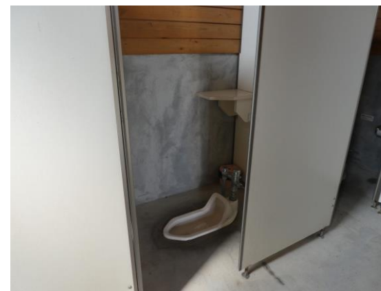
男女のトイレは和式