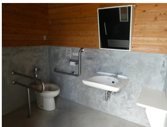
身障者用トイレ内部