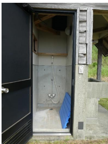
オートサイトのシャワー