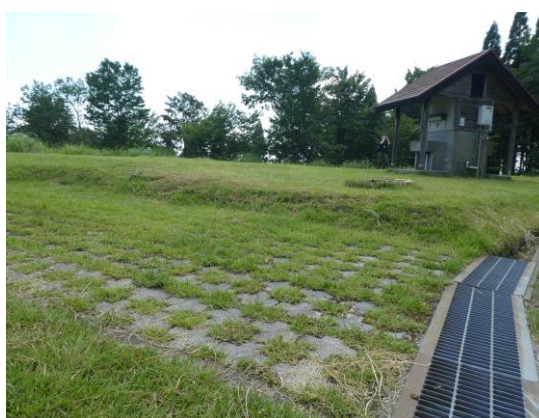
オートサイト駐車場大き目の普通車も駐車可