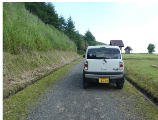
オートサイトの道幅