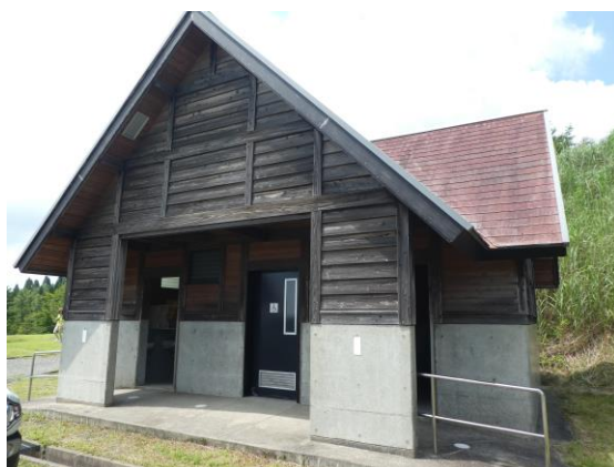
オートサイトのトイレ (男：小便器3、大便器2 女：大便器3)