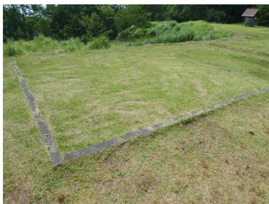
テント設置場所 (6 m × 6 m)