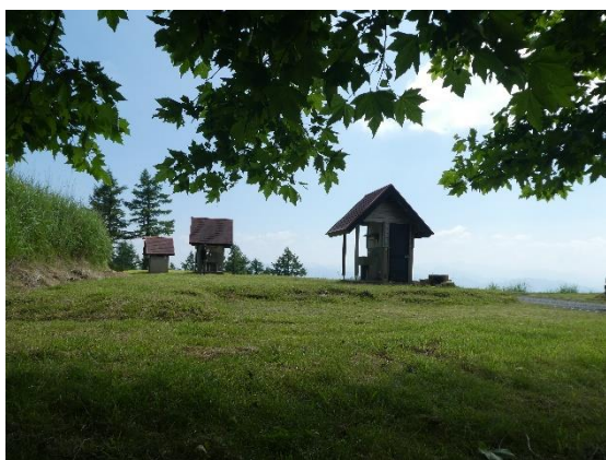
NO.3の横にある木陰からの景色