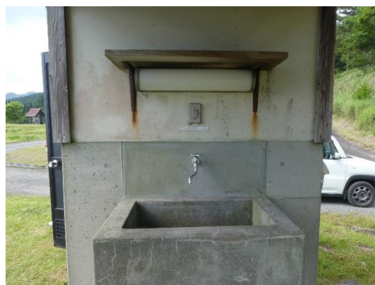
シャワー共有棟 (NO.11～NO.16) AC 電源有 炊事場