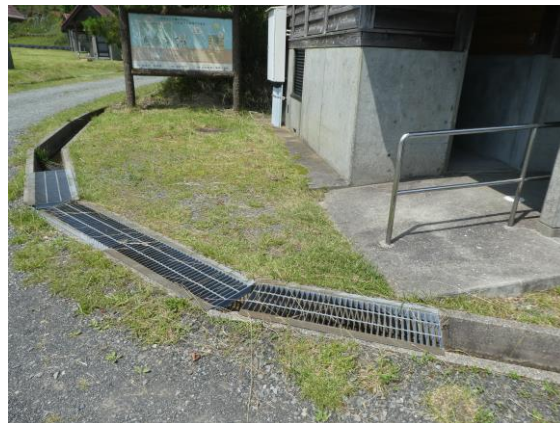
オートサイトのトイレ入り口にはスロープ、手すり有