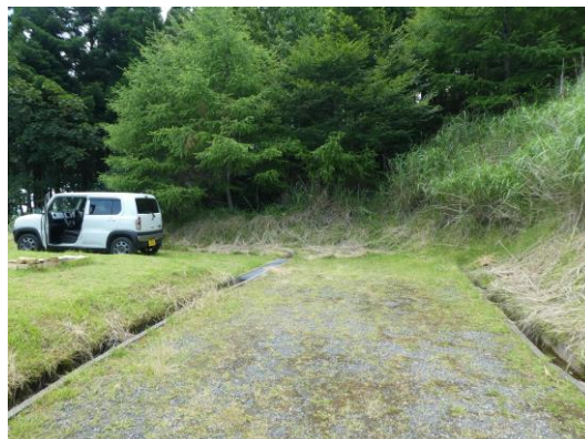
NO.16 大きい車は出庫が困難かも。